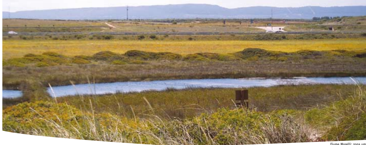
Fiume Morelli: zona umida

fanno di questo tratto di litorale un inestimabile patrimonio agro-ambientale, oggi fortemente a rischio. I fattori di minaccia che incombono sull'area sono legati soprattutto all'uso intensivo delle spiagge nel periodo estivo, ma non trascurabili sono le minacce di alterazione degli habitat da incontrollati usi agricoli. Oltre a fenomeni di alterazione sistemica degli habitat costieri dovuti a processi di urbanizzazione a forte e devastante impatto, la linea di costa brindisina, e in particolare quella compresa nel tratto tra Torre Canne e Torre San Leonardo soffre di problemi di modifica della dinamica evolutiva dei litorali. L'area in questione, come evidenziano alcune ricerche scientifiche portate avanti dalle università pugliesi, sembra interessata da una forte erosione costiera, con un deficit nel bilancio sedimentario (cioè dei materiali sabbiosi che alimentano la spiaggia emersa e sommersa) che si sta acuendo nel tempo, determinando un arretramento complessivo della linea di costa. L'intensiva opera di bonifica delle aree paludose avvenuta nella prima metà