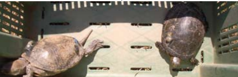
Esemplari di E.o.h. reintrodotti in natura con radiotrasmittitore

I 5 esemplari reintrodotti in natura sono stati monitorati per 12 mesi. Le sessioni di osservazione, con rilevazione degli spostamenti degli esemplari liberati, sono state eseguite 3-4 volte alla settimana nel periodo di massima attività (Aprile-Settembre), due volte alla settimana nei mesi di Marzo e Ottobre e una volta ogni 15 giorni da Novembre a Febbraio periodo di latenza invernale della specie. Durante ogni singola sessione le osservazioni sono state eseguite tre volte al giorno (8-10; 12-14; 16-18). Periodicamente, gli esemplari sono stati catturati e sottoposti a indagine veterinaria per valutarne lo stato di salute.