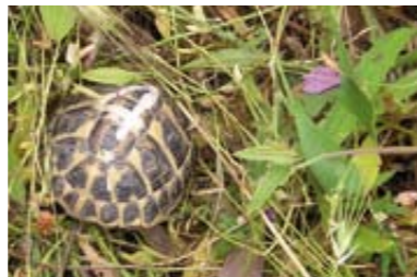
Testuggine terrestre ( Testudo hermanni )