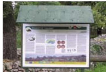
Pannello didattico Progetto Cilona

L'Associazione ALTERIUS è nata nel luglio 2006 grazie alla passione di quattro professionisti del settore ambientale che sentivano la forte necessità di creare un organismo che si occupasse della cosiddetta fauna "minore", con una particolare attenzione nei confronti di rettili e anfibi, troppo spesso considerati animali non indispensabili o addirittura negativi per l'ambiente stesso. Essi, al contrario, vanno protetti e tutelati perché componenti essenziali ed insostituibili degli ecosistemi terrestri e dulciacquicoli. Questi vertebrati, inoltre, essendo molto sensibili alle variazioni di alcuni parametri ambientali possono rappresentare degli ottimi indicatori dello stato di salute dell'habitat in cui vivono.