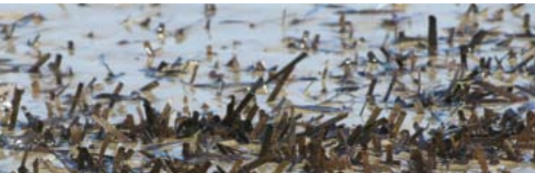
Posidonia oceanica spiaggiata

fanno di questo tratto di litorale un inestimabile patrimonio agro-ambientale, oggi fortemente a rischio. I fattori di minaccia che incombono sull'area sono legati soprattutto all'uso intensivo delle spiagge nel periodo estivo, ma non trascurabili sono le minacce di alterazione degli habitat da incontrollati usi agricoli. Oltre a fenomeni di alterazione sistemica degli habitat costieri dovuti a processi di urbanizzazione a forte e devastante impatto, la linea di costa brindisina, e in particolare quella compresa nel tratto tra Torre Canne e Torre San Leonardo soffre di problemi di modifica della dinamica evolutiva dei litorali. L'area in questione, come evidenziano alcune ricerche scientifiche portate avanti dalle università pugliesi, sembra interessata da una forte erosione costiera, con un deficit nel bilancio sedimentario (cioè dei materiali sabbiosi che alimentano la spiaggia emersa e sommersa) che si sta acuendo nel tempo, determinando un arretramento complessivo della linea di costa. L'intensiva opera di bonifica delle aree paludose avvenuta nella prima metà