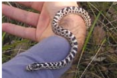
Cervone ( Elaphe quatuorlineata )