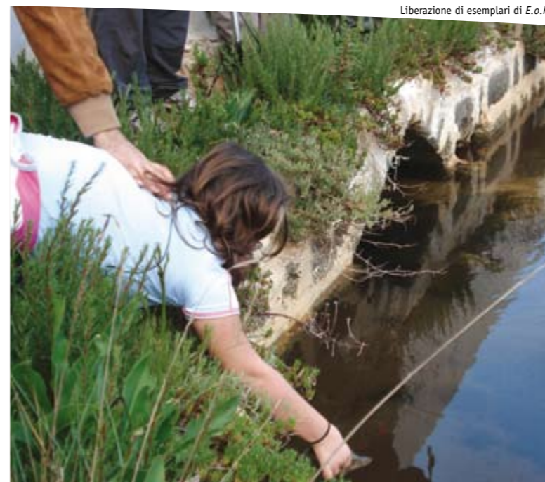
Liberazione di esemplari di E.o.h.

Dapprima è stato effettuato uno studio ecologico dell'area designata per valutare la sua idoneità al ripopolamento e per stabilire la presenza di esemplari di testuggine palustre europea in natura.